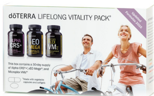
dōTERRA LIFELONG VITALITY PACK™ COMPLÉMENTS ALIMENTAIRES CONTENANT ALPHA CRS™+, MICROPLEX VMZ™ ET xEO MEGA™