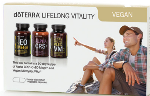
dōTERRA LIFELONG VITALITY VEGAN PACK™ COMPLÉMENTS ALIMENTAIRES CONTENANT ALPHA CRS™+, MICROPLEX VMZ™ ET vEO MEGA™